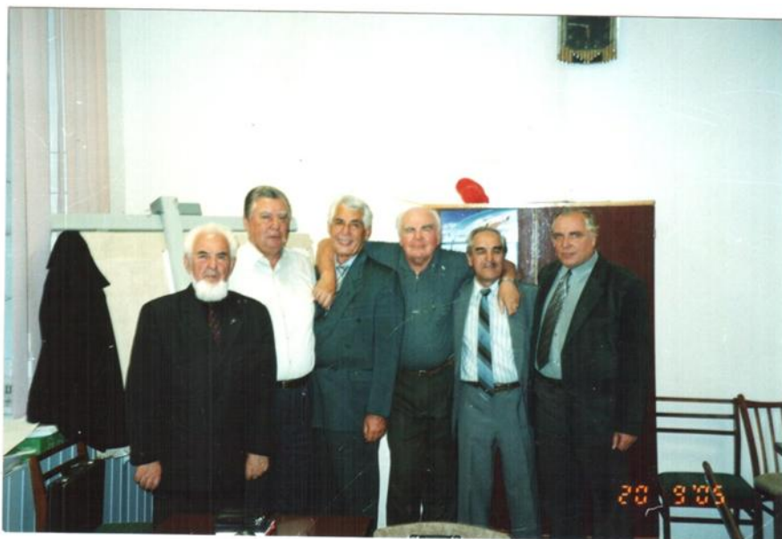
Атестаційна комісія після захисту дисертацій в ХІІ