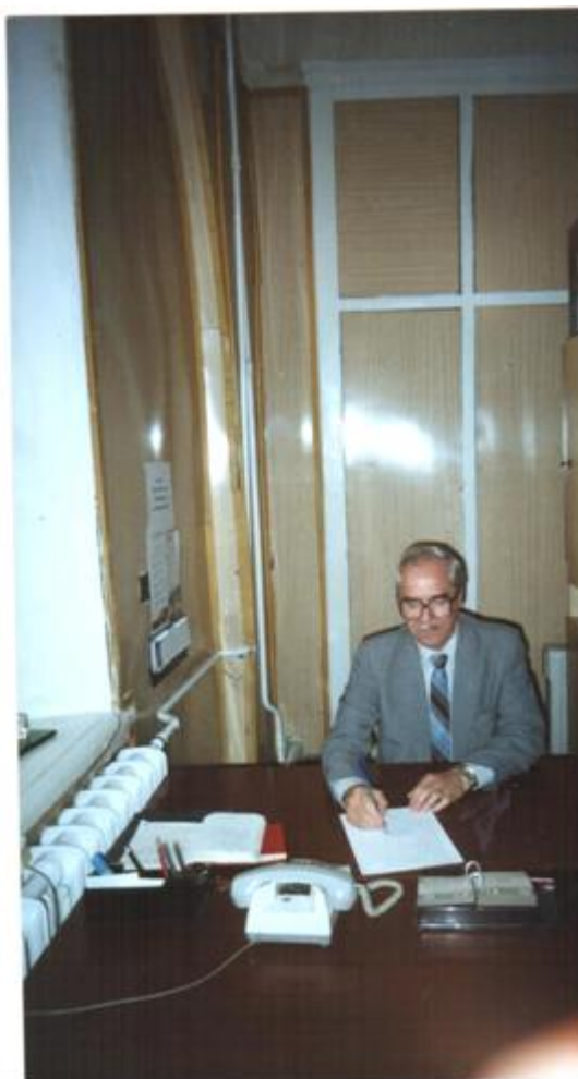
За роботою у кабінеті