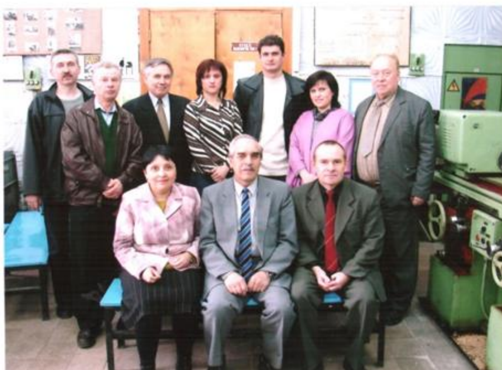
На кафедрі зі співробітниками, 2004 р.