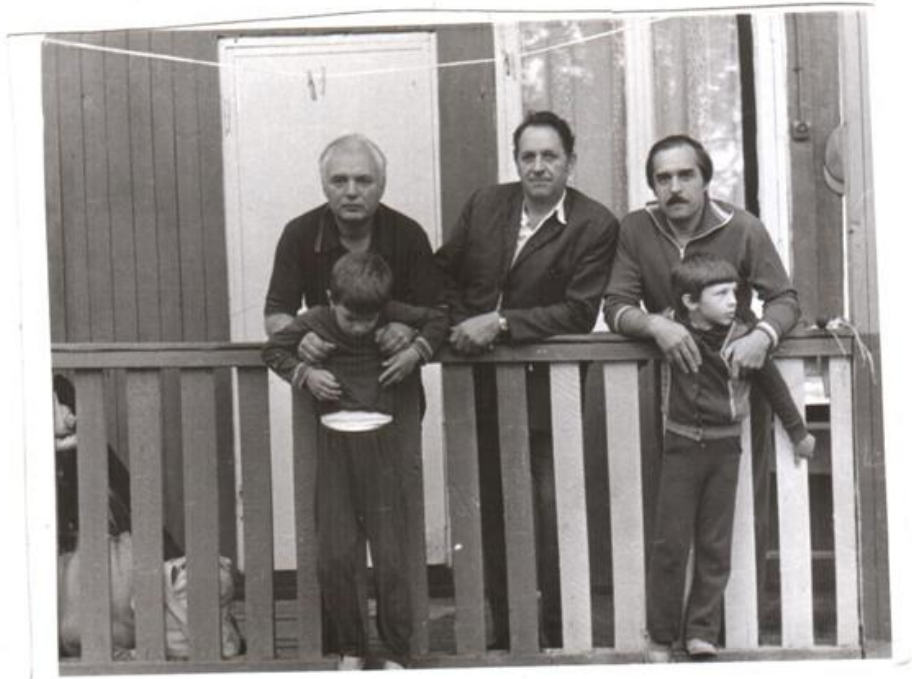
Відпочинок з колегами та дітьми у Буймерівці