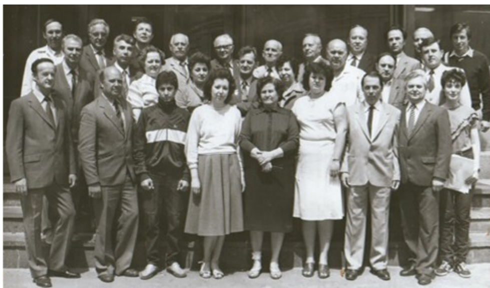
Рис. 2 Склад кафедри у 1988 році