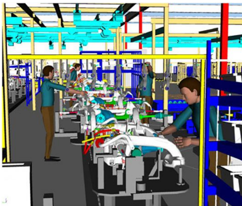
Рис. 2 – Проектирование технологии сборки

сборочных линий; балансировки загрузки линий и анализа производственных затрат. В результате обеспечивается технологический процесс, содержащий полное описание того, как изделие изготавливается, собирается, испытывается и упаковывается. Такое описание техпроцесса выступает основой для совместной работы технологов, производства, поставщиков и субподрядчиков.