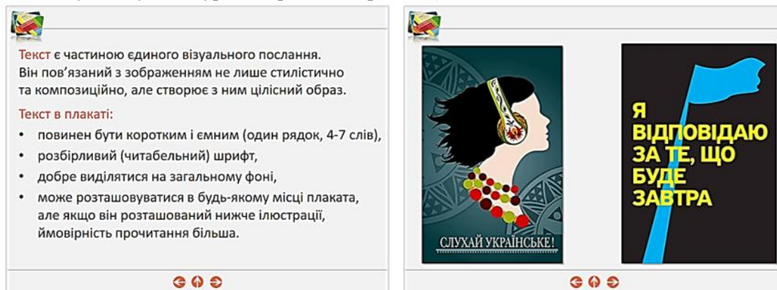
Рис. 1. Фрагменти електронного освітнього ресурсу з елементами патріотичного виховання

Розглянемо приклади, що демонструють цю позицію. Так, при розгляді теми «Плакат», в електронному посібнику можна навести велику кількість прикладів вітчизняних плакатів, які не лише допоможуть розкрити питання заняття і наочно підкріпити текстовий матеріал, а й побічно продемонструють студентам красу і велич Батьківщини, пробудять любов до рідної мови, спонукатимуть до турботи про землю (рис. 1, 2).