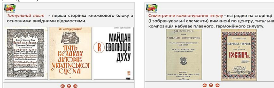
Рис. 3. Фрагменти електронного освітнього ресурсу з елементами патріотичного виховання

Інший приклад використання виховного потенціалу дисципліни «Видавничий дизайн» із метою патріотичного виховання студентів. При розкритті питання «Елементи книжкового комплексу» в електронному освітньому ресурсі поряд із зразками світової поліграфії можна представити приклади оформлення української книги, показавши студентам, що вітчизняні книги минулого і сьогодення – це унікальні взірці друкованих видань (рис. 3).