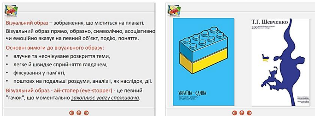
Рис. 2. Фрагменти електронного освітнього ресурсу з елементами патріотичного виховання

Інший приклад використання виховного потенціалу дисципліни «Видавничий дизайн» із метою патріотичного виховання студентів. При розкритті питання «Елементи книжкового комплексу» в електронному освітньому ресурсі поряд із зразками світової поліграфії можна представити приклади оформлення української книги, показавши студентам, що вітчизняні книги минулого і сьогодення – це унікальні взірці друкованих видань (рис. 3).