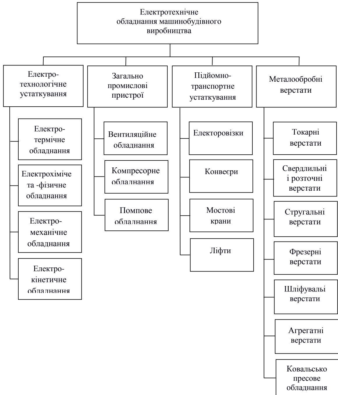
Рис. 1. Класифікація електротехнічного обладнання машинобудівного виробництва

За характером дії на речовину, що обробляється, все електротехнологічне устаткування можна розділити на окремі групи характерних пристроїв.