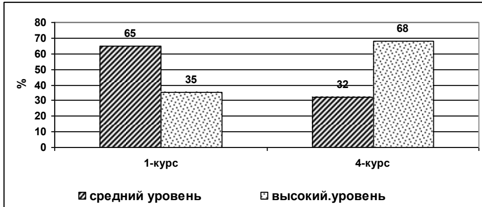
Рис. 3. Уровни сформированности духовного здоровья студентов – валеологов первого и четвертого годов обучения.

Важным моментом в валеологическом учебно-воспитательном процессе является применение форм и методов образования и воспитания духовно-морального направления; создание лично направленных учебно-педагогических ситуаций и позитивной эмоциональной атмосферы во время учебного процесса; привлечение студентов к исследовательской деятельности формирования духовного здоровья.