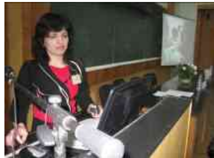
Обмін досвідом під час роботи семінару.