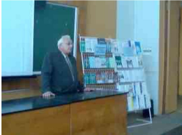
Проведення занять із студентами по основам інформаційної культури