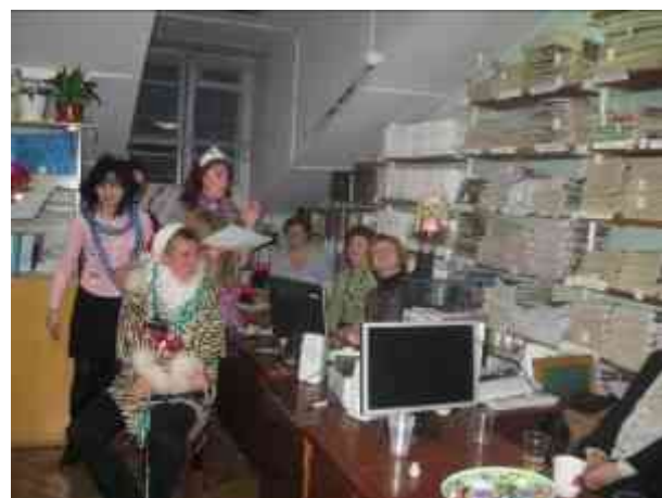
Наш оберіг – бібліотечний домовинок