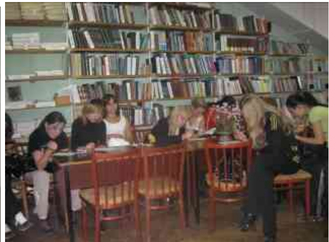
Бібліотека – за відкритий доступ