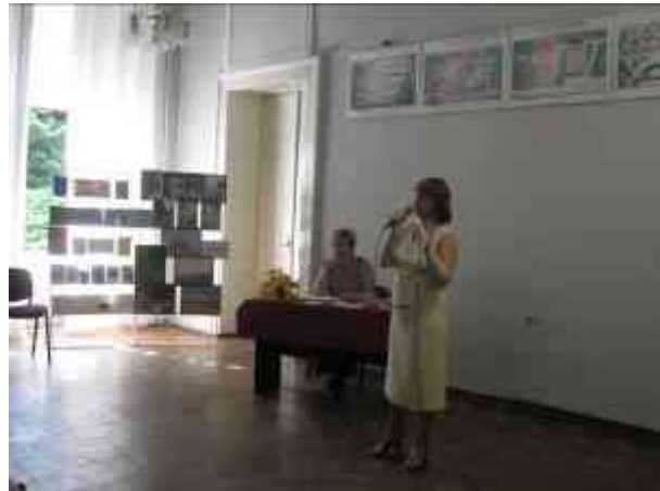
«День бібліотек» у Сквородинівці