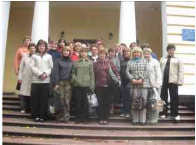
Експедиція у Святогорськ